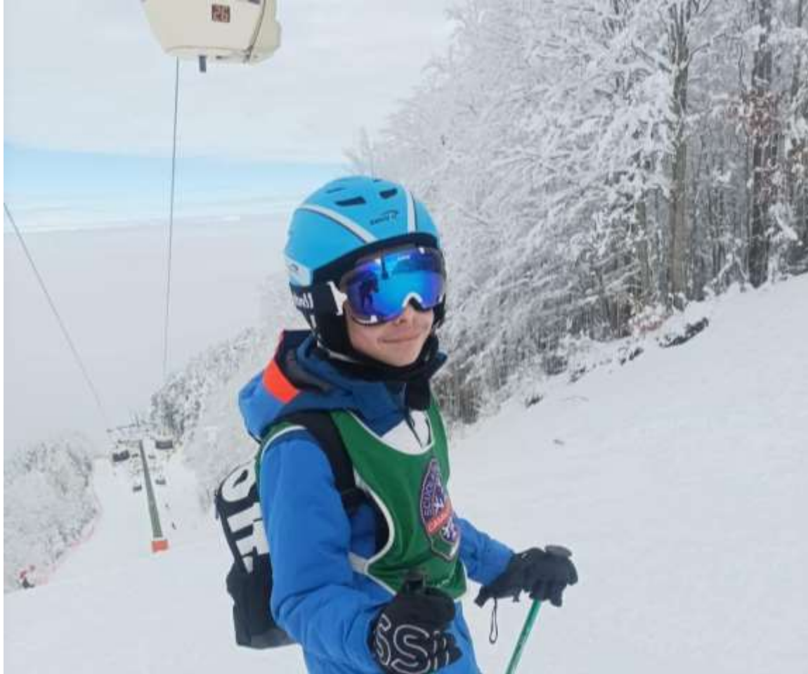
Pista rossa Camigliatello Silano