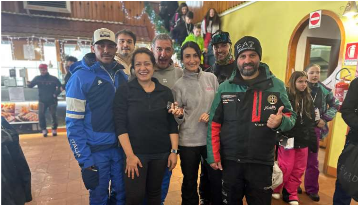
Maestri e Professori

“Sila Neve: la montagna è per tutti” a.s. 2024/2025